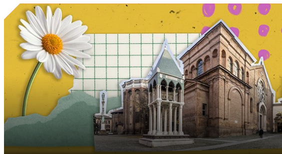
Visita guidata alla Basilica di San Domenico