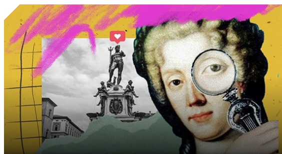
Visita guidata a "Le Donne di Bologna"

SCOPRI TUTTE LE OPPORTUNITÀ RISERVATE AI SOCI