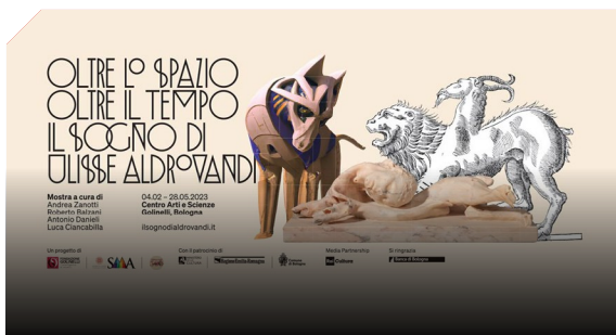
Visita guidata alla mostra di Fondazione Golinelli