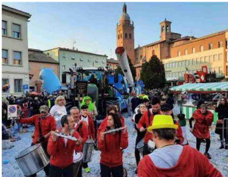
La sfilata del Carnevale di Persiceto di una passata edizione

Per questa edizione la sfilata farà il 'giro lungo' attraverso l'intero Corso Italia