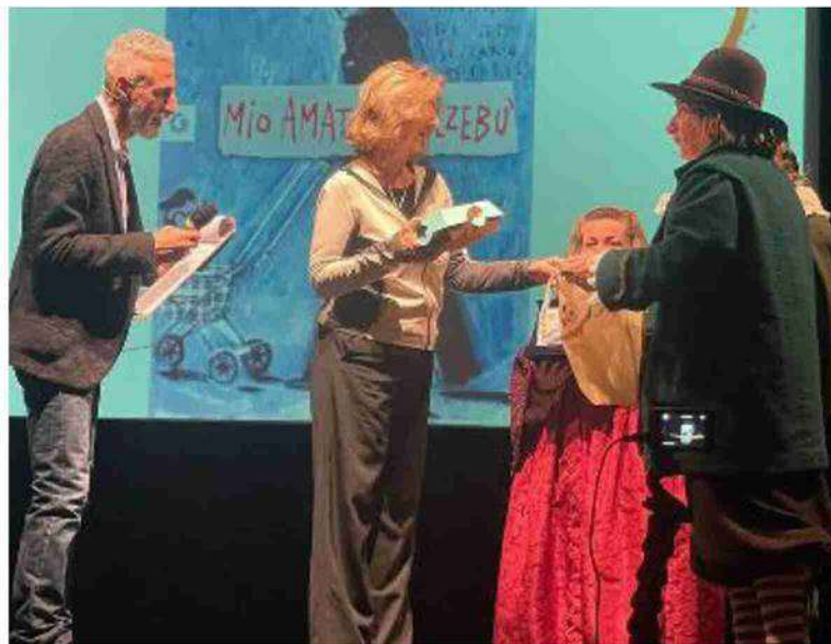
La premiazione di ieri al teatro Comunale di Persiceto

In caso di maltempo gli 'spilli' di oggi saranno rinviati a domenica prossima