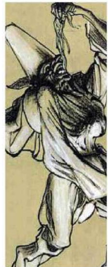
Classica Una delle illustrazioni del libro «Dal villano al sovrano»