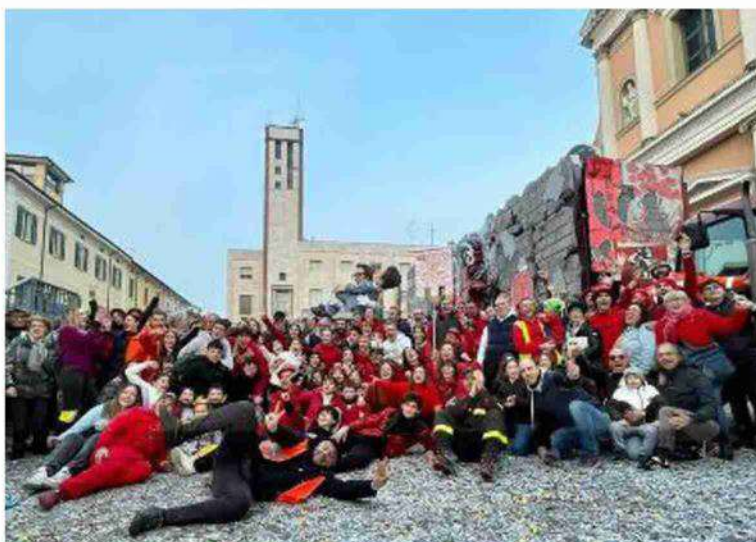
In alto, l'Ocagiuliva vincitrice dell'edizione 2024; sotto Jolly&Maschere, secondi