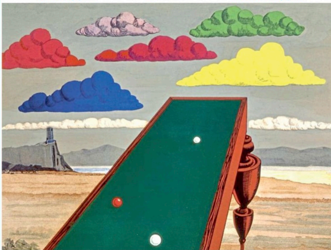
Litografia a colori di Man Ray "La Fortune II" (credit Man Ray 2015 Trust), è una delle opere presentate ad Arte Fiera

Quell'astronave di vetro e calcestruzzo chiamata Gam che 50 anni fa atterrò nel quartiere del progresso Brunella Torresin a pagina 5