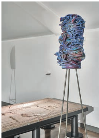
Alessandro Roma, Vestirsi paesaggio , 2024.

La ricerca di Roma dialoga con gli oggetti d'arte delle collezioni museali evidenziando il rapporto con l'artigianalità, la fascinazione per le tecniche compositive, lo studio e il recupero di materiali e manualità. Il percorso riunisce sculture in ceramica su piedistalli in ferro, simili a vasi/fioriere, che vanno trasformandosi in maschere, insieme a due abiti in tessuto dipinto a tempera, associato a ceramica smaltata che richiamano le forme della natura. In collaborazione con CAR Gallery.