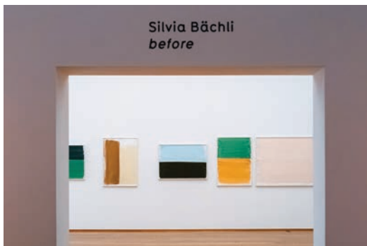
Silvia Bächli, before , veduta della mostra, 2025.

Un nucleo di lavori della collezione permanente dialoga con una serie di opere inedite di Bächli la cui ricerca, caratterizzata dall'uso di atmosfere minimaliste e dall'attenzione per il vuoto e il pieno, trova un'affinità naturale con la pratica di